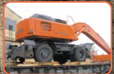
СПЕЦТЕХНИКА для Узбекистана