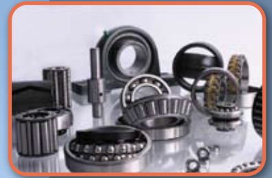
НОВАЯ маркировка запасных частей