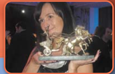
ДИВИЗИОН «Спецтехника» награжден премией «Золотая колесница»