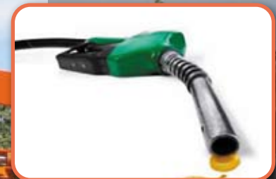
НОВАЯ топливосберегающая система управления